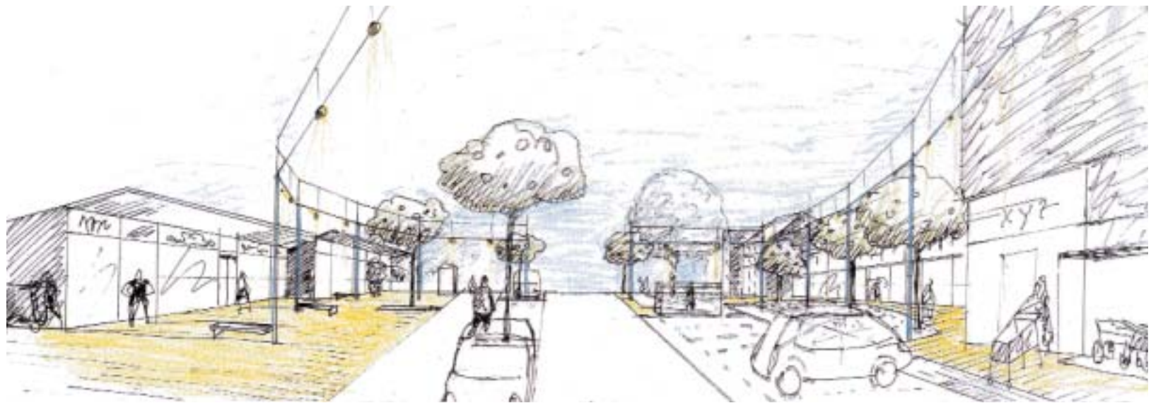
... und ein leuchtendes Licht-Oval für das Einkaufszentrum Hansering

veranstaltung den GrundstückseigentümerInnen und den Gewerbetreibenden des Hanserings zwei Planungsalternativen vorgestellt. Sehr schnell stellte sich heraus, dass eine Variante bevorzugt wurde.