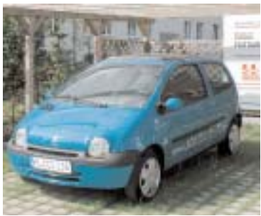
Stattauto-Station in der Bergenstraße

Unterwegs mit dem Auto, wann immer man will, aber keine Parkplatzsuche, keine TÜV-Termine und keinen Werkstattärger, das wär' doch was, oder? Möglich ist das mit STATTAUTO eG,